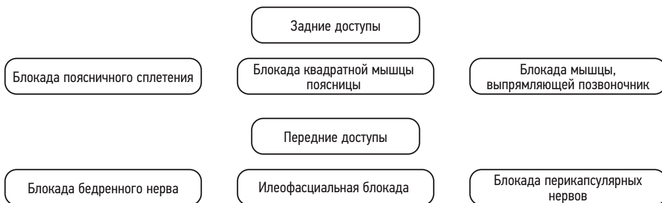
Рис. 1. Различные доступы к ветвям поясничного сплетения. Fig. 1. Various approaches to the branches of the lumbar plexus.

илеофасциальная блокада, которая позволяет выполнить предоперационную подготовку и транспортировку пациента в комфортных для него условиях, что значительно снижает выраженность стрессовой реакции на травму и боль. Супраингвинальная илеофасциальная блокада обуславливает анальгетический эффект в зоне иннервации бедренного, запирающего и бокового кожного нервов бедра при введении большого объёма местного анестетика в низкой концентрации [12, 14]. Анальгетический эффект вполне сопоставим с блокадой поясничного сплетения задним доступом (psoas compartment block). Особенно важно то, что не требуется специальное позиционирование пациента с болевым синдромом, и она может быть выполнена в положении лёжа на спине и значительно проще технически. Тактика выбора плоскостного блока в зависимости от преобладания передней или задней боли представлена на рис. 2.