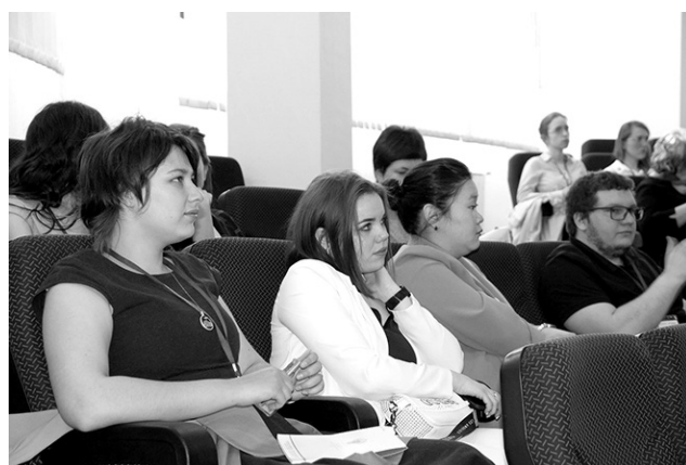
Рис. 3. Клинические ординаторы-анестезиологи заинтересовались вопросами лечения хронической боли.